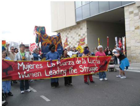
Above / Arriba: Women's Day March 2009, Marcha del Dia de la Mujer 2009

The official 15th annual Cesar Chavez March for Justice starts at the corner of Guadalupe & S. Brazos. Bring a can of food to the march to feed the hungry.