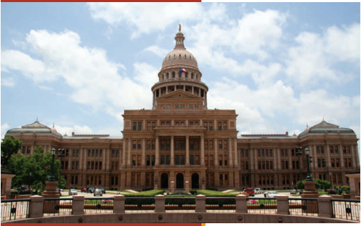
Above/Arriba: Texas Capital Building. La Capital en Austin, TX.

“Women have used International Women’s Day to bring attention to issues ranging from support for affirmative action programs...to equal work for equal pay.”