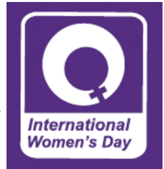
Above/ Arriba: International Women’s Day Logo. Logo del Dia Internacional de La Mujer.

whose careers span from being government leaders, space explorers, business women, spiritual women and women in medicine, to artist, office workers, educators, sportswomen and mothers to name just a few. Considering the state budget cuts to public education we would like to march in solidarity with all educators affected by these proposed cuts. Please join us!